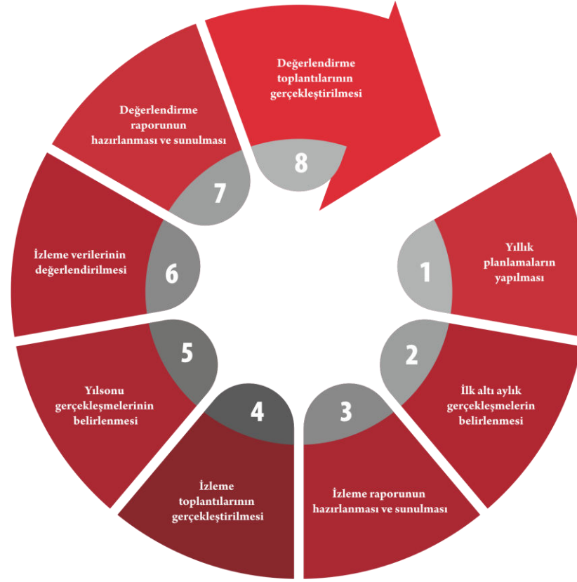
Şekil 2. İzleme Değerlendirme Süreci

Şerafettin Tunalı İlkokulu 2024-2028 Stratejik Plan'ının izleme ve değerlendirme süreci ve takvimi Şekil 2 'de ifade edilmiştir.